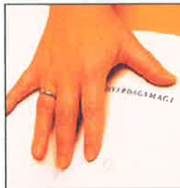
HANDS ON: – Jeg har godtkjent all designen og layouten, sier hun.

– I den forrige boka brukte jeg mange sitater fra andre. Denne boka inneholder kun mine egne